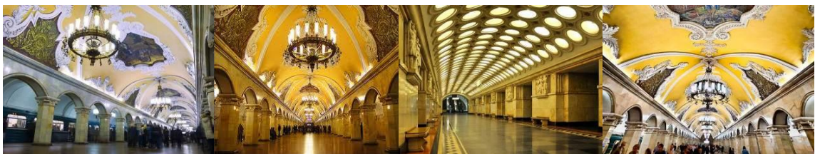
ตัวอย่างสถานีรถไฟใต้ดิน

นำท่านชม สถานีรถไฟใต้ดินกรุงมอสโก (METRO) ทั้งนี้ขึ้นอยู่กับความเหมาะสมในการเข้าชมสถานี METRO ของการเดินทางวันนั้น ๆ สถานีรถไฟใต้ดิน สร้างขึ้นในปี ค.ศ.1931 โดยได้รับการยกย่องจากทั่วโลกว่าเป็นสถานีรถไฟใต้ดินที่สวยงามที่สุดในโลก ซึ่งในแต่ละสถานีจะมีการตกแต่งที่แตกต่างกัน ในสมัยสงครามโลกครั้งที่ 2 สถานีรถไฟใต้ดินได้กลายเป็นหลุมหลบภัยที่ดีที่สุดเพราะมีโครงสร้างที่แข็งแรงรวมทั้งการก่อสร้างที่ขุดลงลึกไปถึงใต้ดินหลาย 10 เมตร และบางสถานียังเป็นที่ยุทธการระหว่างสงครามอีกด้วย ในปัจจุบันรถไฟใต้ดินที่กรุงมอสโกมีถึง 11 สาย 156 สถานีด้วยความยาวทั้งหมด 260 ก.ม.