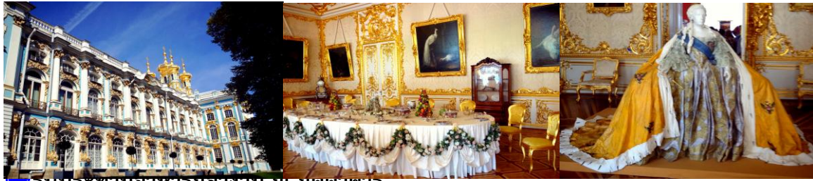
รูปประธานอาหารกลางวัน ณ มรดกคาซาร์

จากนั้นนำท่านเดินทางสู่ พระราชวังฤดูหนาว HERMITAGE MUSEUM ที่มีความสำคัญต่อประวัติศาสตร์ของทั้งประเทศรัสเซียและไทย เนื่องจากในรัชสมัยของพระบาทสมเด็จพระจุลจอมเกล้าเจ้าอยู่หัว รัชกาลที่ 5 พระองค์ได้เสด็จมาประทับที่นี้ขณะเป็นพระราชอาคันตุกะของพระเจ้าซาร์ในคราวเสด็จประพาสยุโรปใน ค.ศ. 1897 หรือ พ.ศ.2440 พิพิธภัณฑ์แห่งนี้ถือเป็นหนึ่งในพิพิธภัณฑ์ที่ใหญ่และเก่าแก่ที่สุดในโลก มีห้องมากถึง 1,050 ห้อง มากถึง 3 ล้านชิ้น ซึ่งส่วนใหญ่จะเป็นภาพเขียน