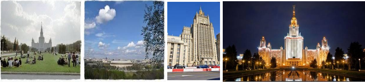
ก ล า ง วั น

จากนั้นนำท่านขึ้นสู่ ยอดเขาสแปร์โรวิล หรือเลนินฮิลล์ (SPARROW HILLS) หรือเนินเขานกกระจอก เป็นบริเวณที่มองเห็นทัศนียภาพ ของนครมอสโกที่อยู่เบื้องล่างได้โดยทั้งหมด จึงทำให้เลนินผู้นำพรรคคอมมิวนิสต์ในอดีต เลือกเนินเขานกกระจอกแห่งนี้เป็นที่ตั้งบ้านพักของตน ปัจจุบันพื้นที่ดังกล่าวเป็นที่ตั้งของมหาวิทยาลัยมอสโก และเป็นจุดชมวิวที่สวยงามที่สุดในมอสโก ที่คู่รักนิยมมาถ่ายภาพแต่งงาน รวมถึงเป็นจุดที่นักท่องเที่ยวให้ความสนใจเป็นพิเศษในการชมบรรยากาศของมอสโก